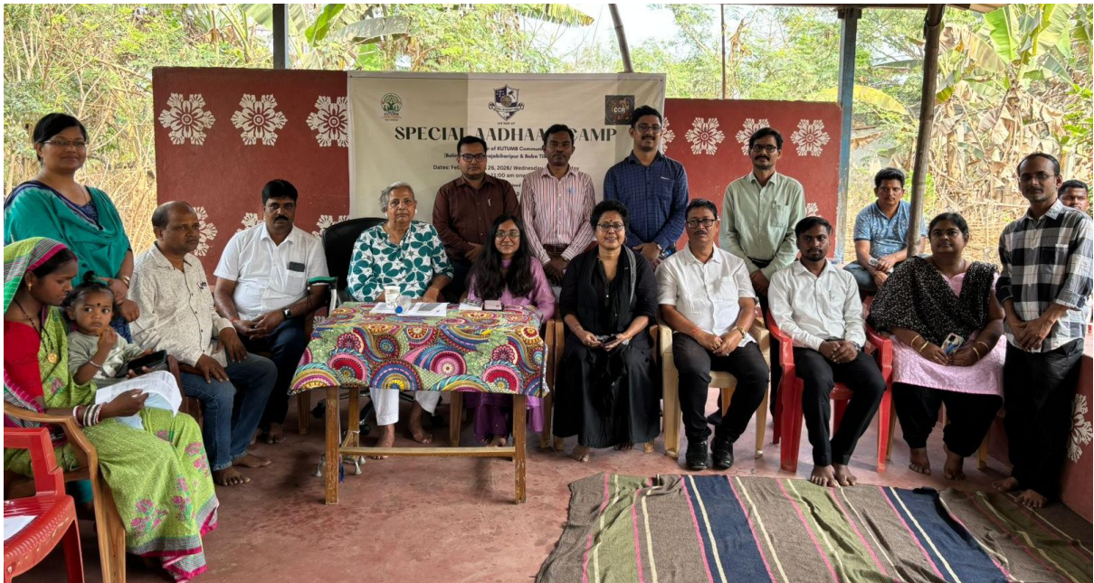
CCR and Project KUTUMB team with the Dignitaries at Opening Programme of Special Aadhar Camp for Children