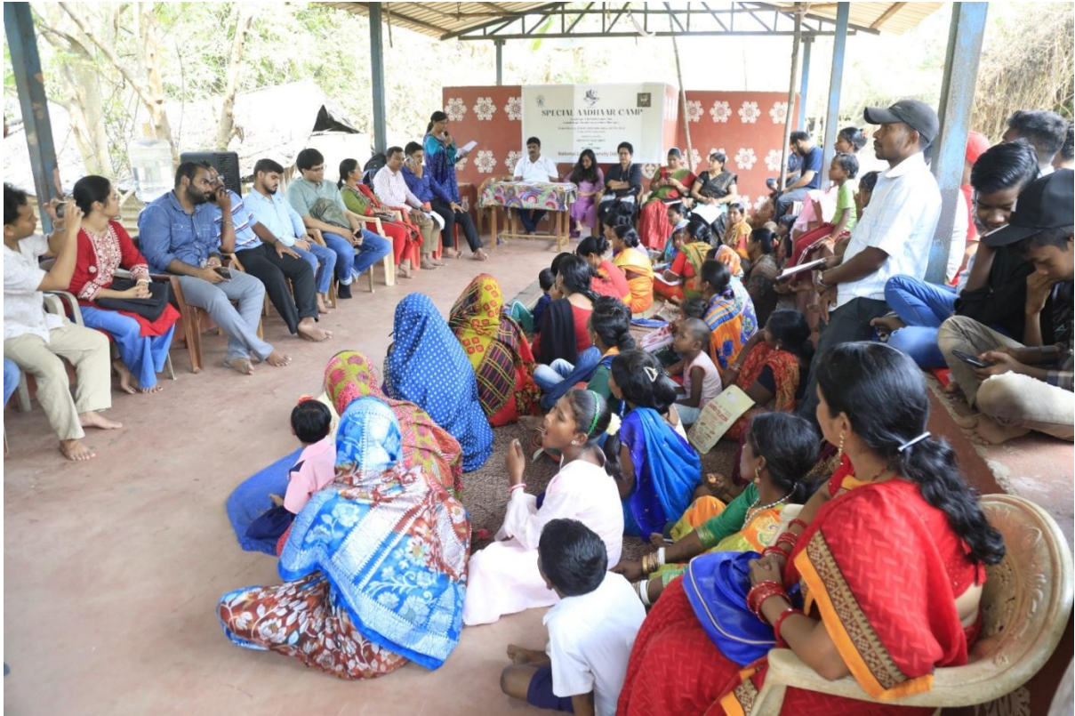
Children and Parents at the Special Aadhar Camp