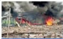
ଦାମ କାନ୍ଦୁଛନ୍ତାରେ ବିଦ୍ରୋହ, ୨୩ ମୁତ